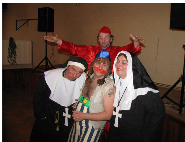
Dospělé maškary 25.2.2012