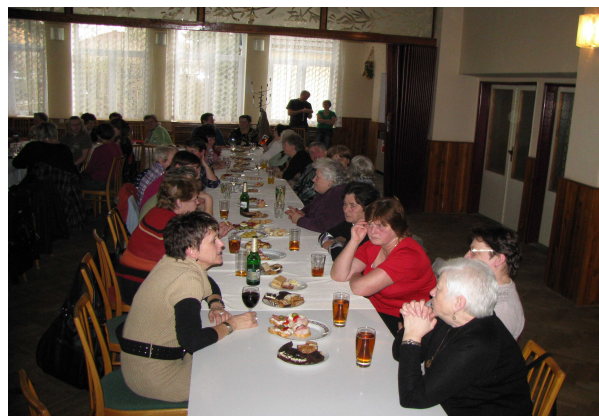
Oslava MDŽ 3.3.2012

(Zdroj: D. Dugas 2007, 500 NEJLEPŠÍCH RECEPTŮ LIDOVÉ MEDICÍNY)