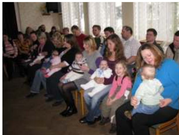
Vítání občánků 24. ledna 2010

Letos jsme opět uspořádali v měsíci únoru dětský maškarní bál, který se setkává se stále větší popularitou, soudě podle narůstající návštěvnosti. První letošní kulturně společenskou událostí ale bylo lednové vítání nových občánků, narozených v roce 2009. Nevím jestli se někdy v historii obce podobná událost konala, ale letos ji obecní úřad uspořádal vzhledem k tomu, že se v naší obci v loňském roce narodilo 8 dětí.