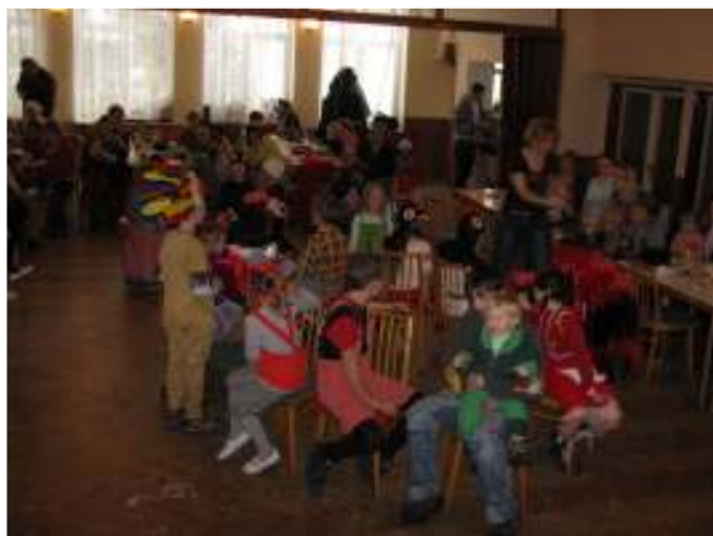
Dětský maškarní 21. února 2010

Fotbalisté Smetanovy Lhoty absolvovali náročnou zimní přípravu, během které odehráli 9 zápasů v rámci turnaje v Kostelci nad Černými lesy. Součástí bylo rovněž zimní soustředění, které proběhlo tentokrát v Horním Maršově v Krkonoších. Doufejme, že se příprava projeví na výsledcích „A“ mužstva, které se tak odlepí ode dna tabulky.