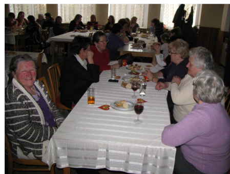
Oslava MDŽ 5.3.2011

Poměry hospodářské v tomto roce se u nás nepatrně zlepšily. Hlavní zásluhu o toto částečné zlepšení hospodářského života jeho rentability má ovšem obilní monopol, který přesně stanovenými cenami lépe zhodnotil práci zemědělcovu a výnosnot jeho hospodářství. Tím ovšem nebylo pomoheno jen jedné zemědělské–vrstvě obyvatelstva, nýbrž nepřimo i obchodu a průmyslu, kteréžto obory jsou úzce spjaty se životem venkova. Kromě toho i větší porozumění pro družstevnictví přispívá k celkovému zlepšení platební schopnosti našeho občana.