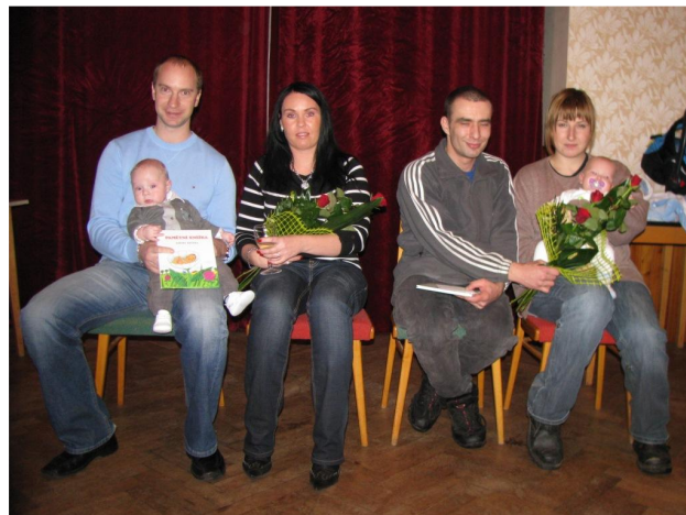
Vítání občánků 4. února 2011

V sobotu 26. března pořádali místní fotbalisté již XVI. sportovní ples. Protože sál v hostinci „U Chmele“ nám začíná být malý, přesunuli jsme ples do sálu obecního úřadu. Sešlo se tentokrát přes 100 platících účastníků.