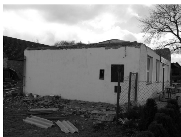
Takhle teď vypadají kabiny

tradiční posezení žen. Blíže o se o těchto akcích dočtete v rubrice Kultura.