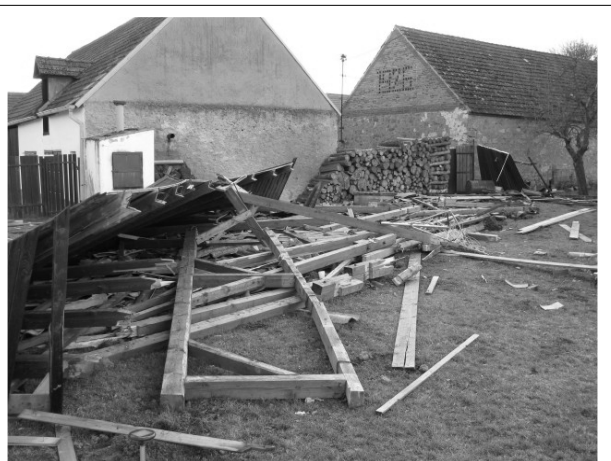
Stržená střecha kabin

Od posledního vydání zpravodaje uplynulo několik měsíců. Během této doby se v naší obci stala řada událostí. Ani naší obci se nevyhnulo řádění vichřice Ema. Kromě několika shozených tašek ze střech, vznikla největší škoda na budově kabin hráčů u fotbalového hřiště. Z budovy byla nárazem vichřice stržena střecha včetně nosné konstrukce a štítu.