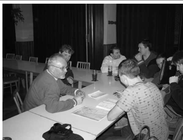
Výbor AFK při volbě nového předsedy.

Každoroční letní akce „Memoriál Ladislava Panýrka“ a „Večer na návsi“ se letos uskuteční 19. července. O jiných kulturních akcích Vás budeme včas informovat prostřednictvím plakátů.