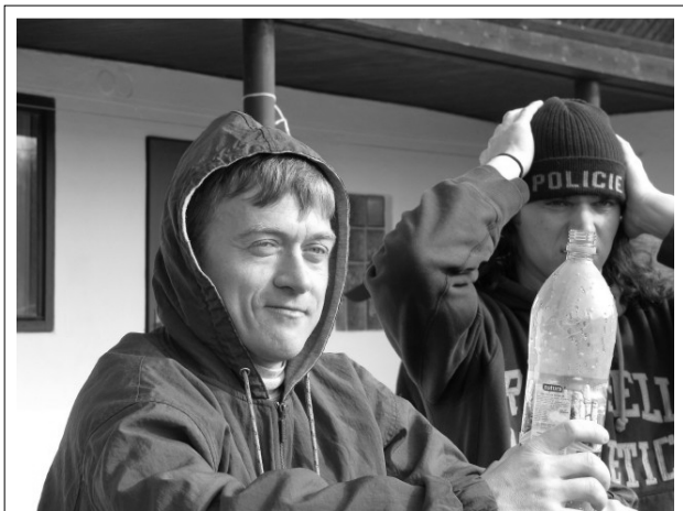
Náročnost letošního soustředění fotbalistů je zřejmá z výrazu tváře jednoho ze zúčastněných .

To, že se ve Smetanově Lhotě hraje kvalitní fotbal je zřejmé z výsledků a postavení našeho mužstva v tabulce. Naše mužstvo je po 18. kole, ve kterém zvítězilo nad mužstvem Albrechtice B v poměru 7:0, na 5. místě tabulky.